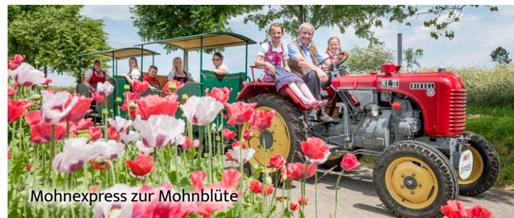
Mohnexpress zur Mohnblüte

Seit über 30 Jahren widmen wir uns im Mohndorf Armschlag dem Thema „Mohn“. Unser kleines Dorf zählt im Sommer zu den buntesten Attraktionen des Waldviertels. Auch heuer haben wir wieder ein vielfältiges Angebot für Sie vorbereitet.